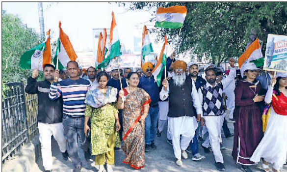
कालावाली। सरदार पटेल की जयंती के उपलक्ष्य में कालावाली में निकाली गई पदयात्रा में शामिल लोग।