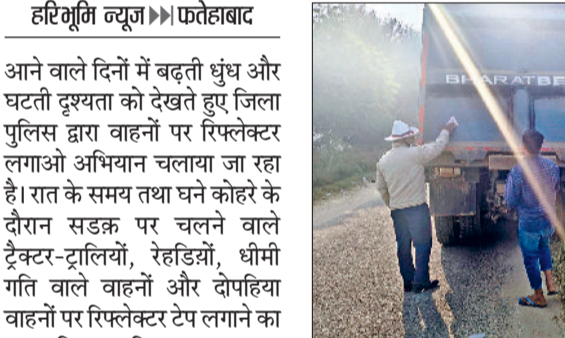
करा रही हैं, जिससे कम दृश्यता में भी वाहन दूर से दिखाई दें और दुर्घटनाओं पर प्रभावी रोकथाम हो सके। पुलिस अधीक्षक सिद्धांत

आने वाले दिनों में बढ़ती धुंध और घटती दृश्यता को देखते हुए जिला पुलिस द्वारा वाहनों पर रिप्लेक्टर लगाओ अभियान चलाया जा रहा है। रात के समय तथा घने कोहरे के दौरान सड़क पर चलने वाले ट्रैक्टर-ट्रालियों, रेहडिओं, धोमी गति वाले वाहनों और दोपहिया वाहनों पर रिप्लेक्टर टैंग लगाने का यह अभियान पुलिस द्वारा युद्धस्तर पर जारी है। यातायात पुलिस टीमों ग्रामीण अंचलों और मुख्य सड़कों पर जाकर वाहन चालकों को रिप्लेक्टर के महत्व से अवगत