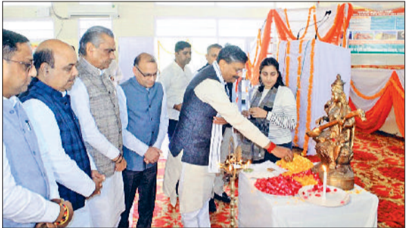
फतेहाबाद। जिला स्तरीय कार्यक्रम का शुभारंभ करते कैबिनेट मंत्री कृष्ण बेदी।

फतेहाबाद के किसानों के खाते में बुधवार को प्रधानमंत्री किसान सम्मान निधि योजना के तहत 21वीं किस्त ट्रांसफर कर दी गई। इस योजना के तहत आज जिले के 76,947 किसानों को 15.39 करोड़ रुपये की सम्मान राशि सीधे उनके खातों में ट्रांसफर की गई है। इस बार पिछली किस्त की तुलना में किसानों की संख्या में 5037 की कमी आई वहीं 2.68 करोड़ रुपये का कम भुगतान हुआ है। किसानों के लिए आज राष्ट्र पर प्रधानमंत्री नरेन्द्र मोदी ने तमिलनाडु के कोयंबटूर से आयोजित दक्षिण भारत प्राकृतिक कृषि शिखर सम्मेलन में 18 हजार करोड़ रुपये की 21वीं किस्त ट्रांसफर की जबकि मुख्यमंत्री नायब सिंह सैनी ने पलवल में आयोजित प्रदेश स्तरीय कार्यक्रम में भाग लिया। फतेहाबाद में कैबिनेट मंत्री कृष्ण बेदी ने किसानों के खाते में राशि डाली। फरवरी 2019 में प्रधानमंत्री नरेन्द्र मोदी ने किसानों के लिए प्रधानमंत्री किसान निधि योजना