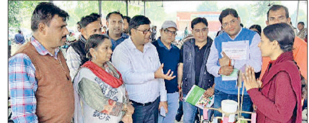
ओढ़ां। विज्ञान प्रदर्शनी का अवलोकन करते हुए निर्णायक मंडल के सदस्य।

विभिन्न प्रतियोगिताओं के विजेताओं को शिक्षकों ने आगे बढ़ने के लिए प्रेरित किया