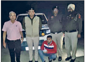
सिरसा। पकड़ा गया हेरोइन तस्क़र।

पुलिस ने गांव मीरपुर कॉलोनी क्षेत्र से एक नशा तस्क़र को करीब छह लाख रुपये की हेरोइन सहित गिरफ्तार किया है। एबीवीटी स्ट्राफ सिरसा प्रभारी सब इंस्पेक्टर गुरमेश ने बुधवार को बताया कि पुलिस टीम रात के दौरान गांव मीरपुर नहर की तरफ जा रही थी। इस दौरान नहर के नजदीक युवक बैठा दिखाई दिया। सामने पुलिस की गाड़ी को