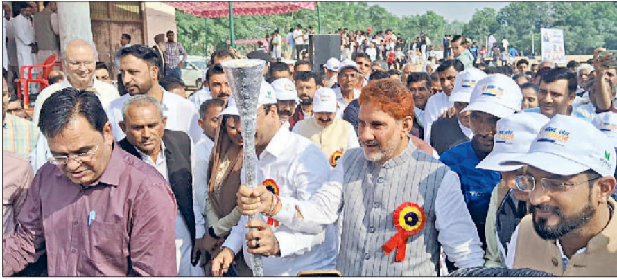
सिरसा। सांसद खेल महोत्सव का शुभारंभ करते सुभाष बराला।